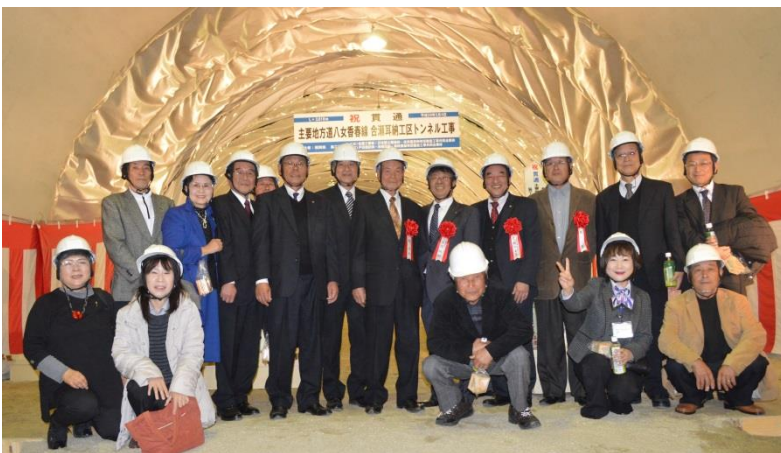
▲トンネル貫通式(平成29年3月4日、トンネル坑内)

▲ 浮羽町と星野村では、第6回全国棚田サミットを共同開催(平成12年9月13、14日)