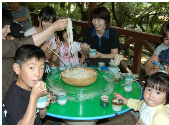
“九州三大麺処”うきは 人気のソーメン流し