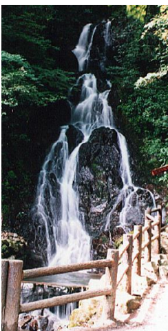
落差 27m 調音の滝 滝壺からの涼風!

■問い合わせ (報道対応)うきは市住環境建設課建設管理係 TEL0943-75-4983 (一般から)うきは市観光協会 TEL0943-77-5611