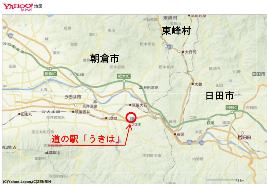
Copyright (C) 2017 Yahoo Japan Corporation. All Rights Reserved.