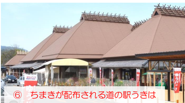
⑥ ちまきが配布される道の駅うきは